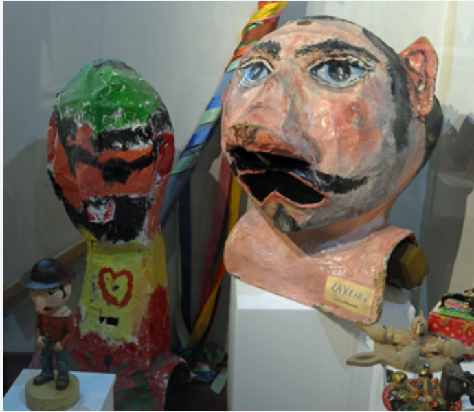
Los cabezudos pintados por Wily (izquierda) y Laxeiro (derecha) en Museo Galego da Marioneta (Lalín).

de 1994 en un recién nacido Centro Galego de Arte Contemporánea– o la retrospectiva que dedicó mismo centro al artista lalinense Xosé Otero Abeledo «Laxeiro» en 1996, suponen indudablemente mis primeros contactos con un formato que hasta aquel entonces, de cubo blanco había tenido más bien poco.