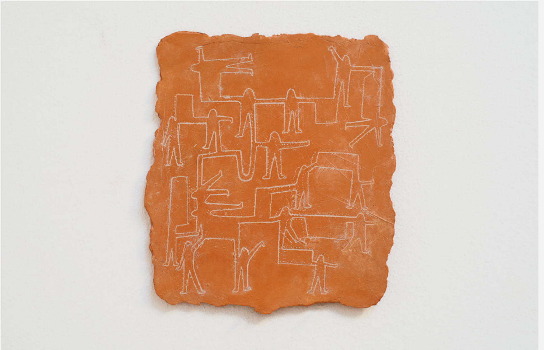
Cuidar , Maja Escher