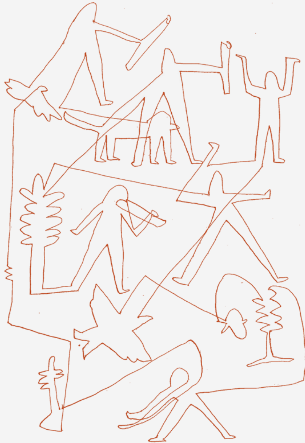
Cuidar , Maja Escher